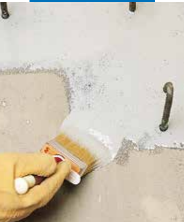
Eporip felhordása munkahézag köthídként