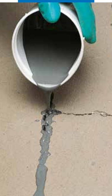
Cementkötésű esztrich repedésjavítása Eporip-pel